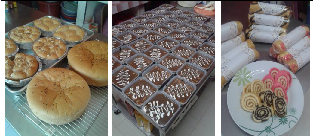
Caption : Pelbagai jenis roti dan kek yang dihasilkan di Aloyah Bakery